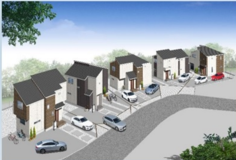
*イメージパースにつき現況優先とさせていただきます。